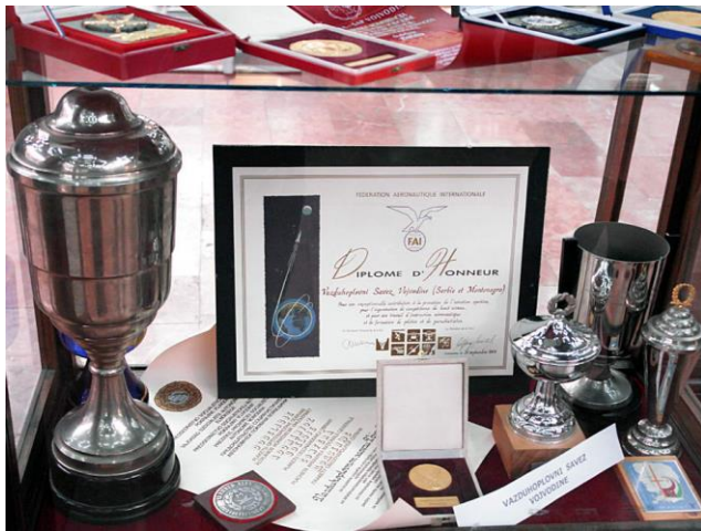
Deo pehara, plaketa, medalja i diploma VSV i visoko priznanje Međunarodne vazduhoplovne federacije „Počasna grupna diploma FAI“ dodeljena VSV