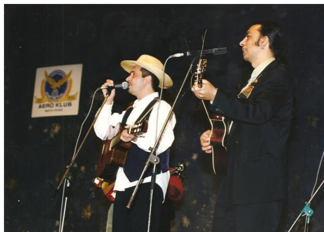
„Garavi sokak“ na proslavi AK „Novi Sad“