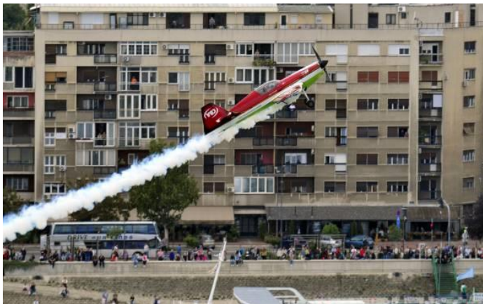
Nezaboravan aero-miting u Novom Sadu septembra 2013. g.