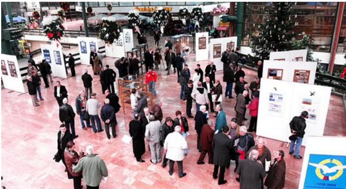
Izložba na SPENS-u povodom 80 godina Vazduhoplovnog saveza Vojvodine, novembar 2008.

Vazduhoplovni savez Vojvodine je periodično organizovao, na "SPENS"-u i drugim adekvatnim prostorima, i druge tematske izložbe fotografija, maketa, modela, letaćkih sredstava, izložbe dečijih crteža i drugo, povodom godišnjica prvih letova avionom braće Rajt, prvog leta avionom Ivana Sarića, godišnjice Srpskog vazduhoplovstva i drugo.