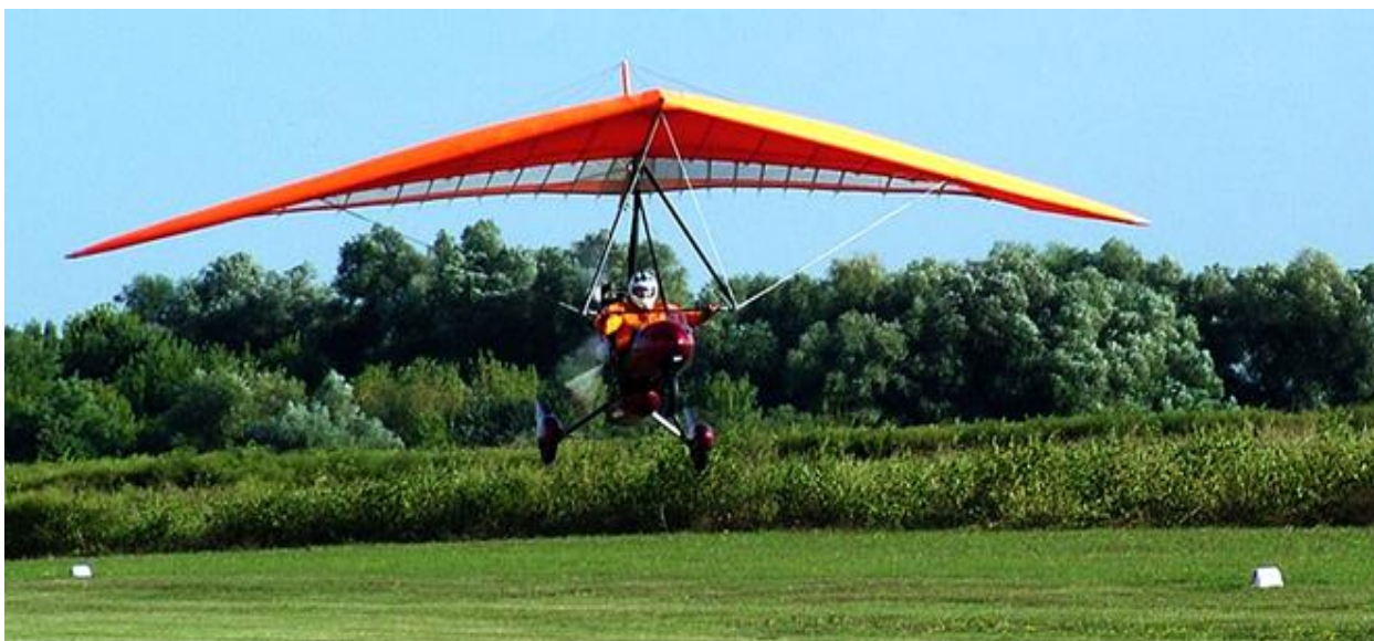
Motorni zmaj na poletanju