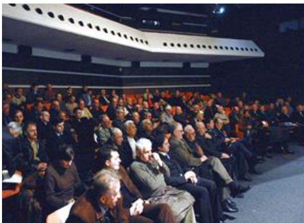
Učesnici Svečane Skupštine: vazduhoplovci i gosti

Vazduhoplovni savez Vojvodine je , u novembru 2008. oodine, obeležavanje Velikih vazduhoplovnih jubileja i proslavu 80 godina od svog osnivanja organizovao u Sportskom i poslovnom centru “Vojvodina”, u Novom Sadu. I tu je sala-amfiteatar, bila ispunjena do poslednjeg mesta. Tom prilikom uručene su plakete i priznanja zaslužnim organizacijama sa kojima VSV ima dobru saradnju na popularizaciji i unapređenju sportskog vazduhoplovstva u AP Vojvodini, kao i zaslužnim pojedincima za postignute vrhunske sportske rezultate i popularizaciju vazduhoplovstva kod nas.