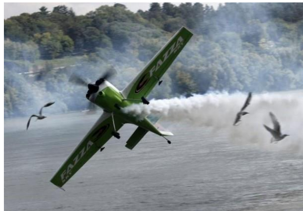
Vrhunske akrobacije nad samim Dunavom

Vazduhoplovni sportovi nisu masovni sportovi, a sportski aerodromi nisu u centru grada, kao sportske hale. Zato vazduhoplovni sportovi, iako izuzetno atraktivni, nisu uvek pred očima javnosti (jedriličarska, zmajarska i takmičenja motornih pilota-kada su preleti u pitanju), pa su i posete mnogo slabije nego u vreme pre pojave računara i „igrice“.