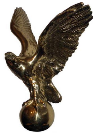
Najveće priznanje VS Srbije, Statua “Zlatnog orla”

Sportisti, sportski radnici i naši aeroklubovi su vlasnici 6 nagrada „Jovan Mikić Spartak“, najvećih sportskih priznanja u Vojvodini, koje dodjeljuje Sportski savez Vojvodine, kao i više desetina svetskih priznanja i diploma za inovacije, za pedagoški rad, za popularizaciju i organizaciju vazduhoplovnih sportova.