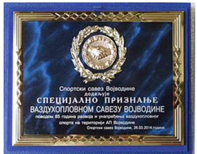
Specijalno priznanje dodeljeno VSV od strane Sportskog saveza Vojvodine

Za ovakav svoj rad Vazduhoplovni savez Vojvodine je dobio mnogobrojne nagrade i priznanja, kao što su: “Počasna grupna diploma FAI“, 2004. godine, za uspešan rad, popularizaciju i unapređenje vazduhoplovnog sporta; Specijalno priznanje Sportskog saveza Vojvodine 2014. godine, povodom 85 godina razvoja i unapređenja vazduhoplovnog sporta na teritoriji AP Vojvodine; Plaketu JNA; Plaketu “Boris Kidrič”, Narodne tehnike Jugoslavije; Plaketu Opšte narodne odbrane, Predsedništva Socijalističke AP Vojvodine; „Zlatnu Plaketu“ Pokrajinske Konferencije AP Vojvodine; i mnogobrojna druga priznanja, diplome i zahvalnice.