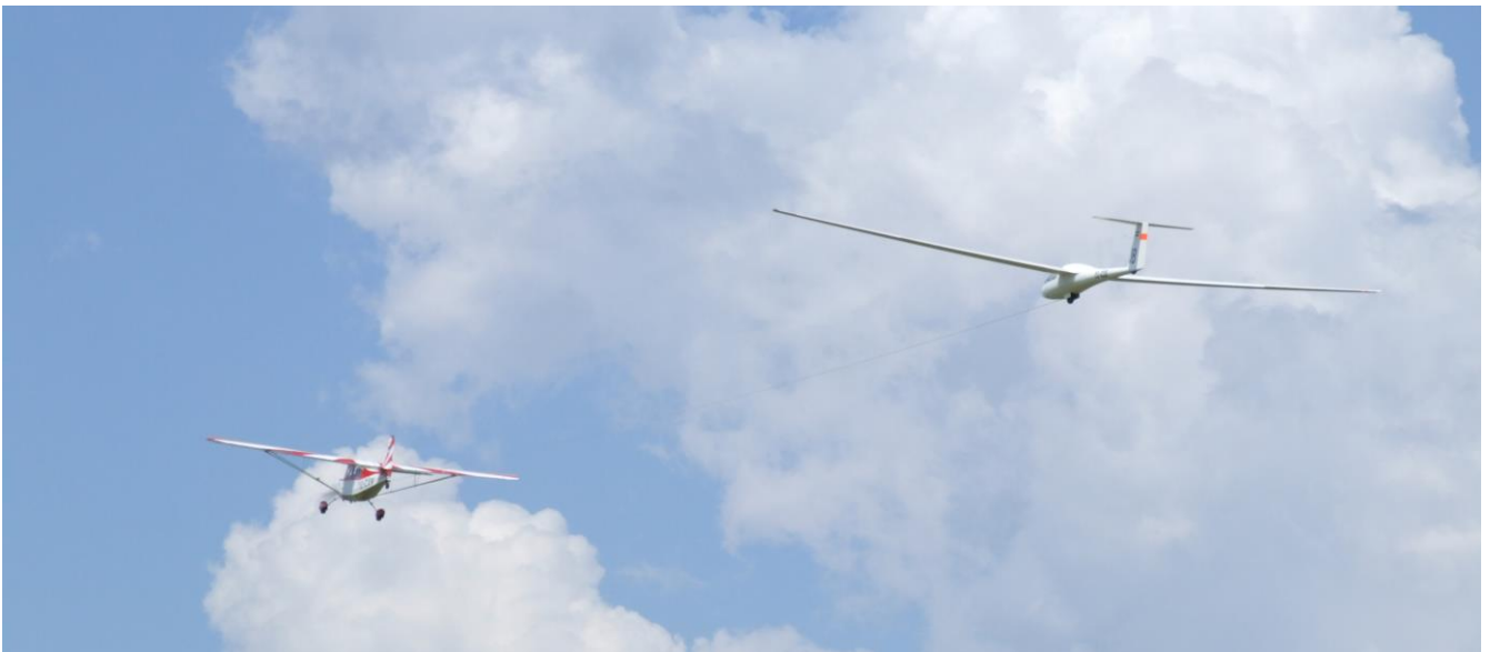
Jedrilica u aero-zaprezi na Državnom prvenstvu 2009.g. na a/d „Čenej“

I danas, jedriličari iz aeroklubova: “Novi Sad”, “Zrenjanin”, “Sremska Mitrovica” i “Subotica”, osvajaju medalje i priznanja na državnim prvenstvima i međunarodnim takmičenjima.