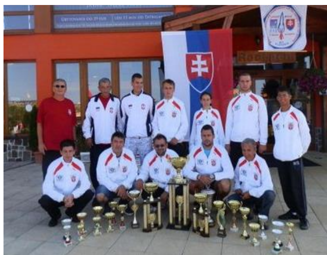
Šampioni 19. FAI Svetskog prvenstva u raketnom modelarstvu, Liptovski Mikulaš, 2012.g.

REPREZENTACIJA SRBIJE (koju 80% čine takmičari iz AP Vojvodine) PROGLAŠENA JE ZA NAJBOLJI TIM SVETSKOG PRVENSTVA 2012. Seniorska reprezentacija za najbolji seniorski tim, a Juniorska reprezentacija (100% članovi VSV) za treću na svetu, u generalnom plasmanu.