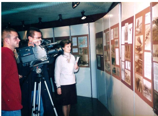
Sa otvaranja izložbe 75 godina AK „Novi Sad“

VSV se, sa svojim aeroklubovima trudi, da kad god je to moguće, svoje letačke aktivnosti prikaže i u samim gradovima i naseljenim mestima. Tako su, na primer, naši padobranci skakali sa reklamnim zastavama na Novosadski poljoprivredni sajam, gradsko kupalište „Štrand“ ili u sam centar Novog Sada, Kikinde, Subotice... U ranijem periodu bila su veoma popularna takmičenja avio-modelara u „vazдушnim bitkama“ dvobojima pomoću snažnih i veoma bučnih modela aviona i drugo. Pored mnogobrojnih oduševljenih posetilaca, ove manifestacije snimaju televizijske kamere, o njima pišu novine, objavljuju fotografije, pa je na taj način, ove događaje video veliki broj ljudi.