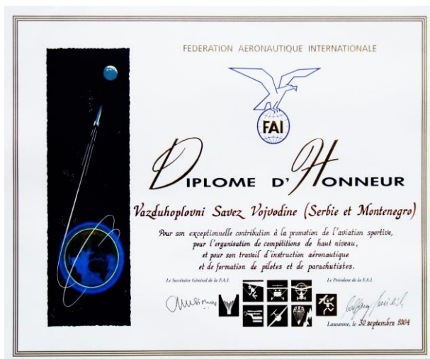
Počasna grupna diploma Međunarodne vazduhoplovne federacije-FAI

Vazduhoplovni savez Vojvodine je sa svojim aeroklubovima uz pomoć i pokroviteljstvo VS Srbije, organizovao 6 SVETSKIH PRVENSTVA, 8 EVROPSKIH PRVENSTAVA i 49 SVETSKIH KUPOVA, kao i mnogobrojna domaća, državna i druga prvenstva i takmičenja.