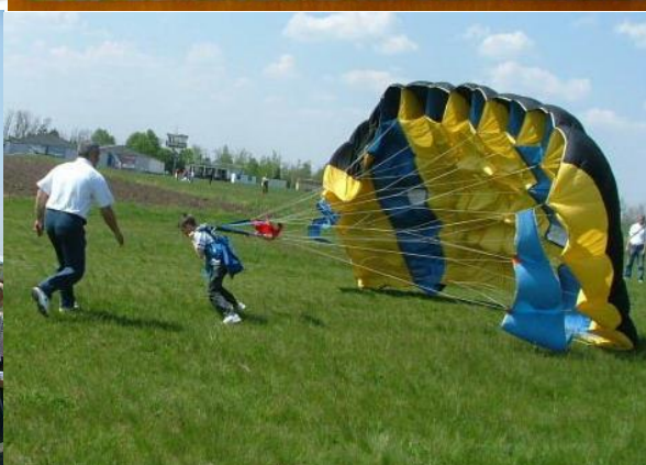
Rad sa decom u AK „Ivan Sarić“, Subotica u okviru projekta „Feniks“

„zaljubljenika plavih visina“ na naše aerodrome, predavanjima, obukama i drugim vidovima pedagoškog rada, nastojimo da pre svega edukujemo, zainteresujemo i ponudimo učenicima osnovnih i srednjih škola širom AP Vojvodine, da se aktivno uključe u neki od naših aeroklubova i počnu da se bave maketarstvom, vazduhoplovnim i raketnim modelarstvom.