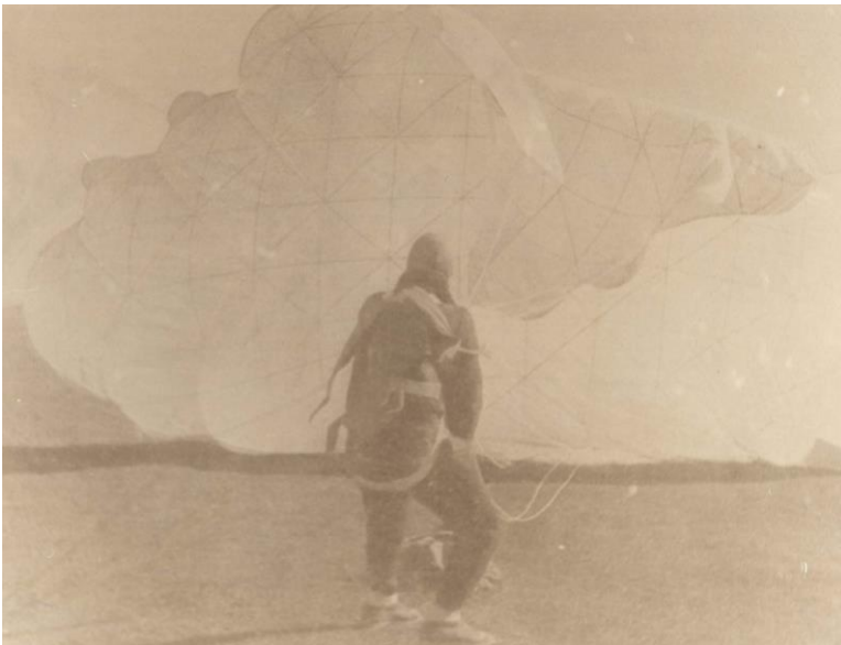
Janko Lutovac 1. juna 1950. na Aerodromu "Jugovićevo" U Novom Sadu postavlja svetski rekord u broju izvedenih skokova u jednom danu – 132 skoka!