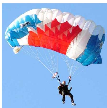
Sa vazduhoplovnih takmičenja organizovanih u AP Vojvodini