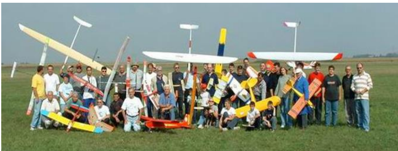
Vazduhoplovni modelari na jednom od mnogobrojnih takmičenja